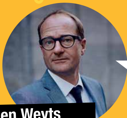
Ben Weyts Vlaams minister van Onderwijs

Veel Vlamingen snakten naar de heropening van de scholen. Heel wat ouders wilden hun kinderen weg van achter de pc thuis, en weer op de schoolbanken. Leerkrachten misten de kinderen. En onze jongeren misten hun vrienden.