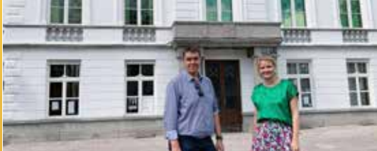
Oud stadhuis in nieuw kleedje (p. 2)