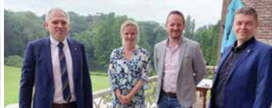
Vlaanderen investeert opnieuw in Egmontstad (p. 2)