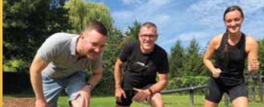
Uitbreiding Finse piste langs nieuw bos (p. 2)