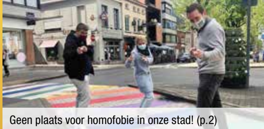
Geen plaats voor homofobie in onze stad! (p.2)