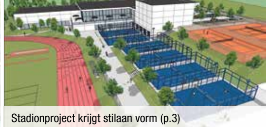
Stadionproject krijgt stilaan vorm (p.3)