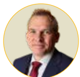
Matthias Diependaele Vlaams minister en raadslid N-VA Zottegem

Onze Vlaamse koppigheid om vol te houden, komt goed van pas om het virus klein te krijgen. Ik wens jullie een goede gezondheid en de nodige veerkracht om samen erdoor te komen. Hopelijk komen we elkaar snel weer tegen om te genieten van de typische Zottegemse gezelligheid.