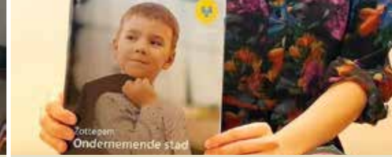
Ondersteuning voor startende ondernemers (p. 3)