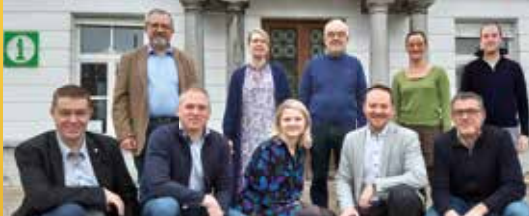
Maak kennis met onze N-VA-fractie (p. 2)