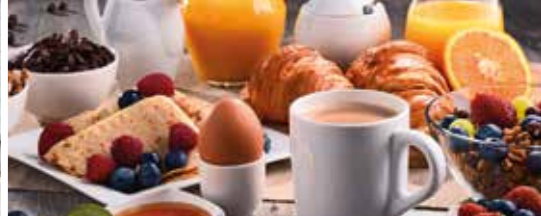
Jaarlijks ontbijt op zondag 6 maart (p. 3)